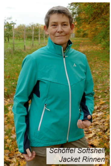
Schöffel Softshell Jacket Rinnen

Unser Fazit: Das Schöffel Softshell Jacket Rinnen eignet sich bestens fürs Wandern in der kühlen Jahreszeit. Die Jacke bietet dank 4-Wege-Stretch herrliche Bewegungsfreiheit und hohen Tragekomfort. Sie kann sich 74% der maximal möglichen Punkte sichern, was ihr das Testurteil «gut» einbringt.