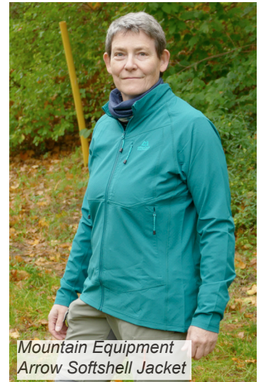
Mountain Equipment Arrow Softshell Jacket

Übrigens: die Jacke gibt es baugleich auch mit Kapuze.