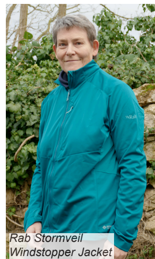
Rab Stormveil Windstopper Jacket

Unser Fazit: Das Stormveil Windstopper Jacket von FairWear Leader Rab eignet sich v.a. bei Temperaturen von 10 bis 20°C sehr gut zum Wandern. Die Jacke kommt auf 77% der maximal möglichen Punkte, was das Testurteil «sehr gut» einbringt.