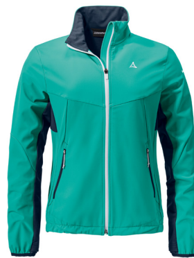
Schöffel Softshell Jacket Rinnen