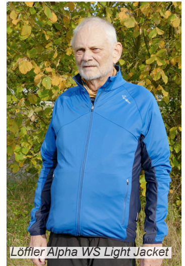
Löffler Alpha WS Light Jacket

Kandidat Nummer 2 ist das leichte Alpha WS Light Jacket von Löffler . Bei dieser relativ dünnen Jacke wird der Wind dank der bluesign und Öko-Tex 100 zertifizierten Gore-Tex Windstopper Membran komplett abgehalten und auch entlang des innen breit hinterlegten 1-Weg Front-RVs mit sehr großer Zip-Garage hat Wind keine Chance einzudringen. Seitlich und unter den Armen sind herrlich dehnbare, etwas dünnere 4-Wege Stretch Einsätze verarbeitet, die den Feuchttransfer optimieren. Die Jacke hat 2 RV-Außentaschen, die man auch mit Rucksack noch gut nutzen kann. Die Armbündchen sind elastisch eingefasst, ebenso wie der Jackensaum, der gut anliegt. Unser Fazit: Das Löffler Alpha WS Light Jacket eignet sich v.a. an Tagen mit Temperaturen zwischen 10 und 20°C prima zum Wandern. Durch die PFC-freie DWR widersteht die, in Europa gefertigte, Jacke auch einem kurzen Nieselregen. Insgesamt kann die Jacke 74% der maximal möglichen Punkte sammeln, wofür es das Testurteil «gut» gibt.