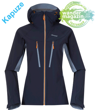
Bergans Cecilie Mountain Softshell Jacket