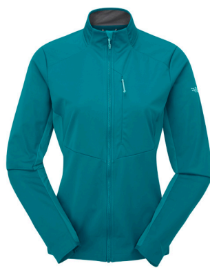
Rab Stormveil Windstopper Jacket