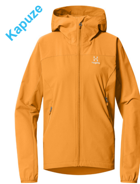
Haglöfs Move Softshell Hood