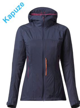
Forclaz Softshell Bergtrekking MT900