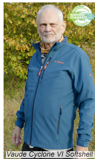
Vaude Cyclone VI Softshell

Unser Fazit: das Vaude Cyclone VI Softshell eignet sich bestens zum Wandern in der kalten Jahreszeit. Die mehrfach zertifizierte Jacke punktet mit hohem Tragekomfort, solider Ausstattung sowie nachhaltigen Materialien. So erreicht sie am Ende 88% der maximal möglichen Punkte, wofür sie nicht nur das Testurteil «sehr gut» bekommt, sondern sich auch das Testsieger-Label der Gruppe ohne Kapuze sichert.