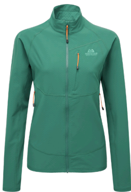
Mountain Equipment Arrow Softshell Jacket